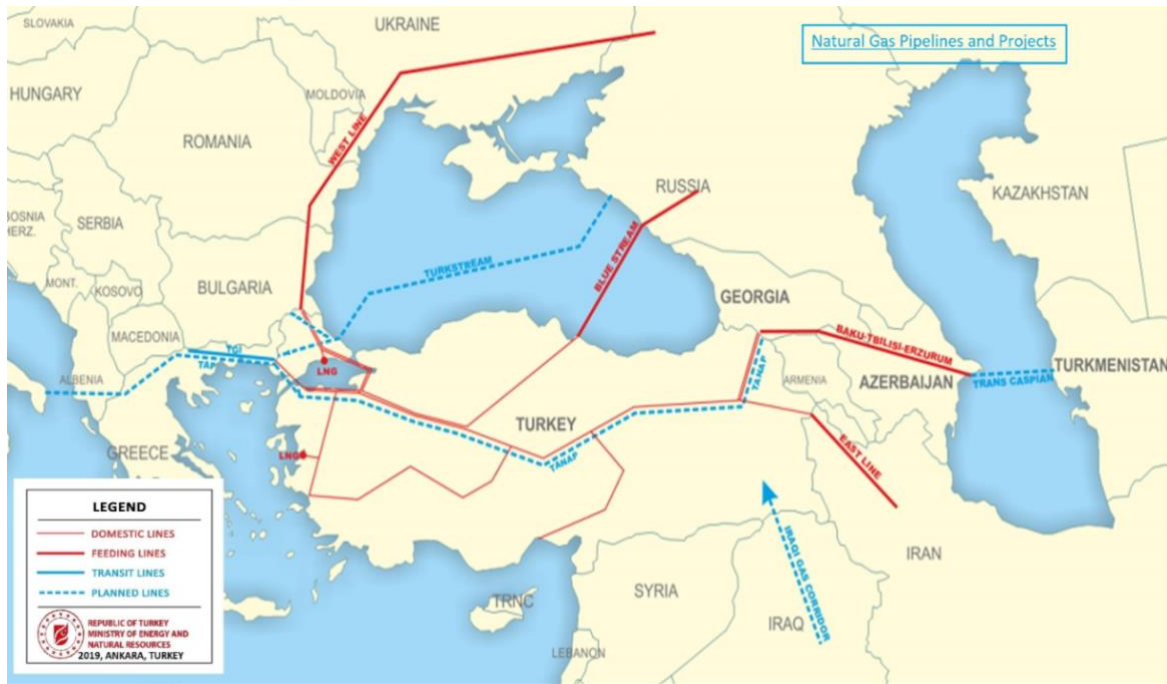
Map I: Natural gas pipelines and projects passing from Turkey

The second important project was Blue Stream ( Mavi Akım ). Within the scope of the 25-year Natural Gas Purchase-Sale Agreement signed between BOTAŞ and Gazexport on December 15, 1997, natural gas is transported from the Russian Federation through a transit line under the Black Sea to Turkey. According to the agreement, 16 billion cubic meters of natural gas per year is supplied to Turkey ( Republic of Turkey Ministry of Energy and Natural Resources ). The pipeline was taken into operation on February 20, 2003 and the official opening ceremony was held on November 17, 2005.